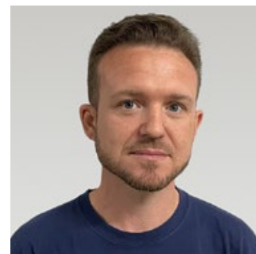
Vladimir Klein Konfektion, Verpackung, Versand/ Assembly, packing, shipping