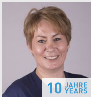
Birgit Frese, Montage/ Montage